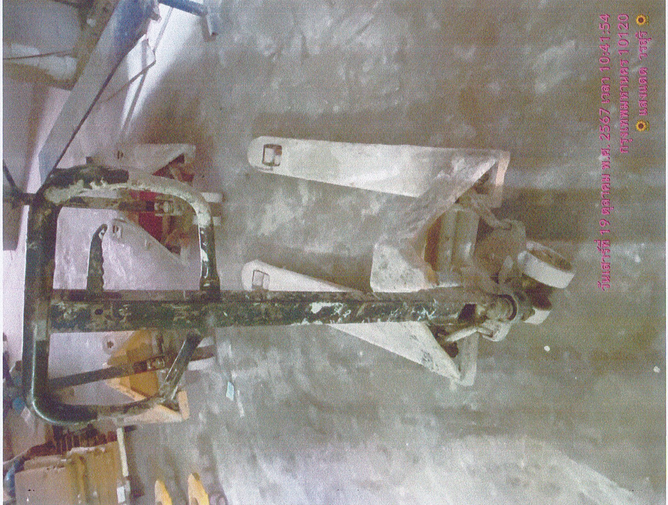
วันเสาร์ที่ 19 ตุลาคม พ.ศ. 2567 เวลา 10:41:54 กรุงเทพมหานคร 10120 แสงแดด วรสุริ