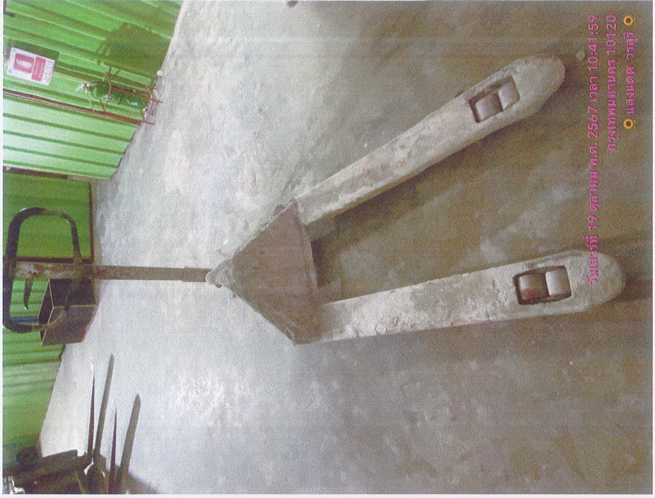
วันเสาร์ที่ 19 ตุลาคม พ.ศ. 2567 เวลา 10:41:59 กรุงเทพมหานคร 10120 แสงแดด วรสุริ