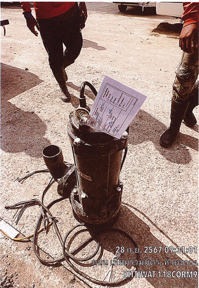
28 ก.ย. 2567 09:31:01 ถนน เทียมร่วมมิตร, ห้วยขวาง KITTIWAT 118CORM9