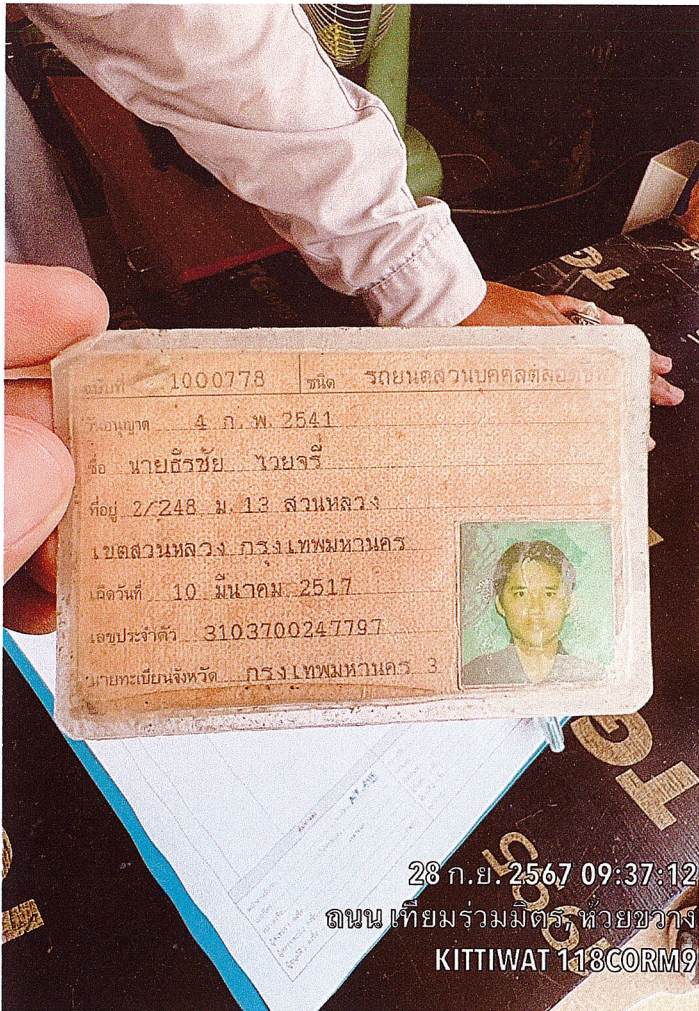
28 ก.ย. 2567 09:37:12 ถนน เทียมร่วมมิตร, ห้วยขวาง KITTIWAT 118CORM9