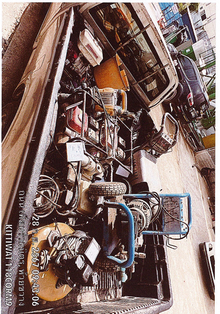
ถนน เทียมร่วมมิตร, ห้วยขวาง 28 ก.ย. 2567 09:43:06 KITTIWAT 118CORM9