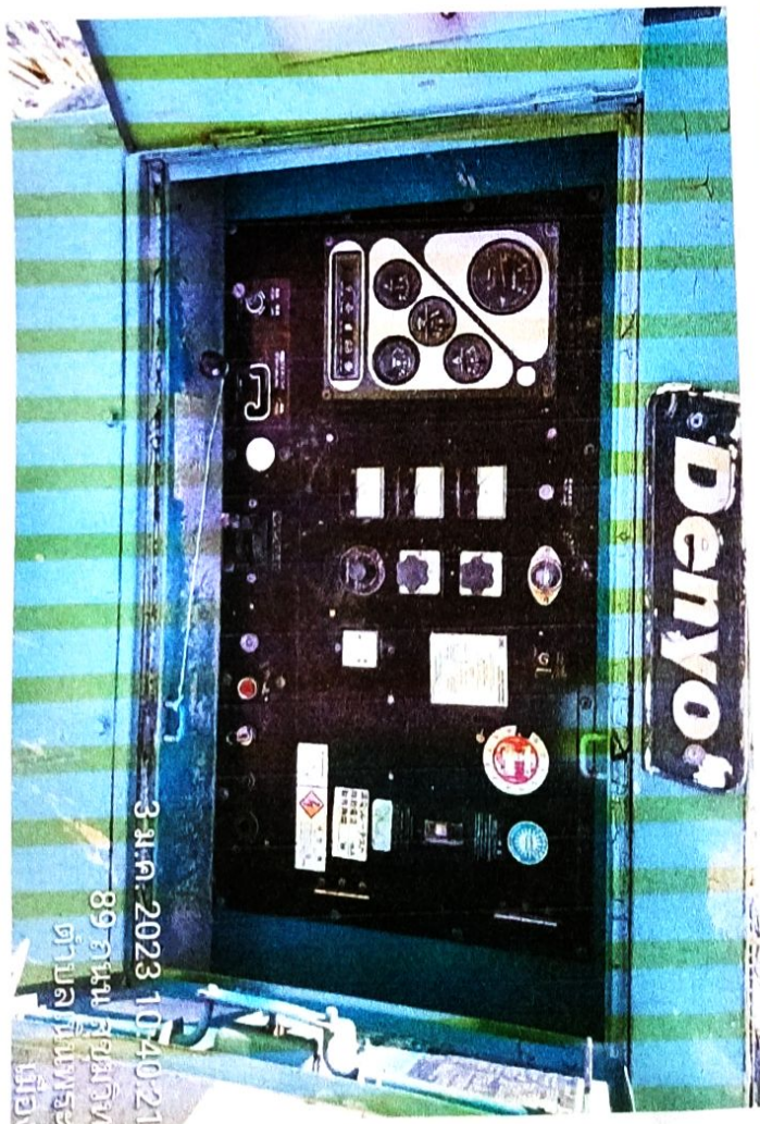
3 ม.ค. 2023 10:40:21 89 ถนนสุขุมวิท ตำบลเนินพระ เมือง