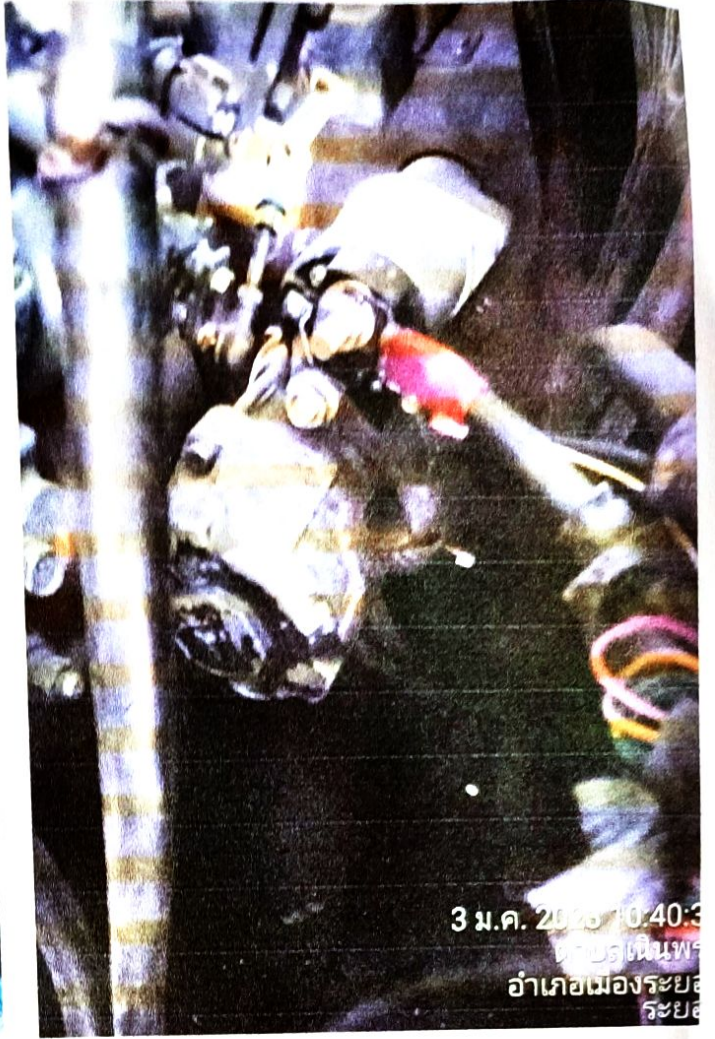
3 ม.ค. 2023 10:40:3 ตำบลเนินพระ อำเภอเมืองระยอง ระยอง