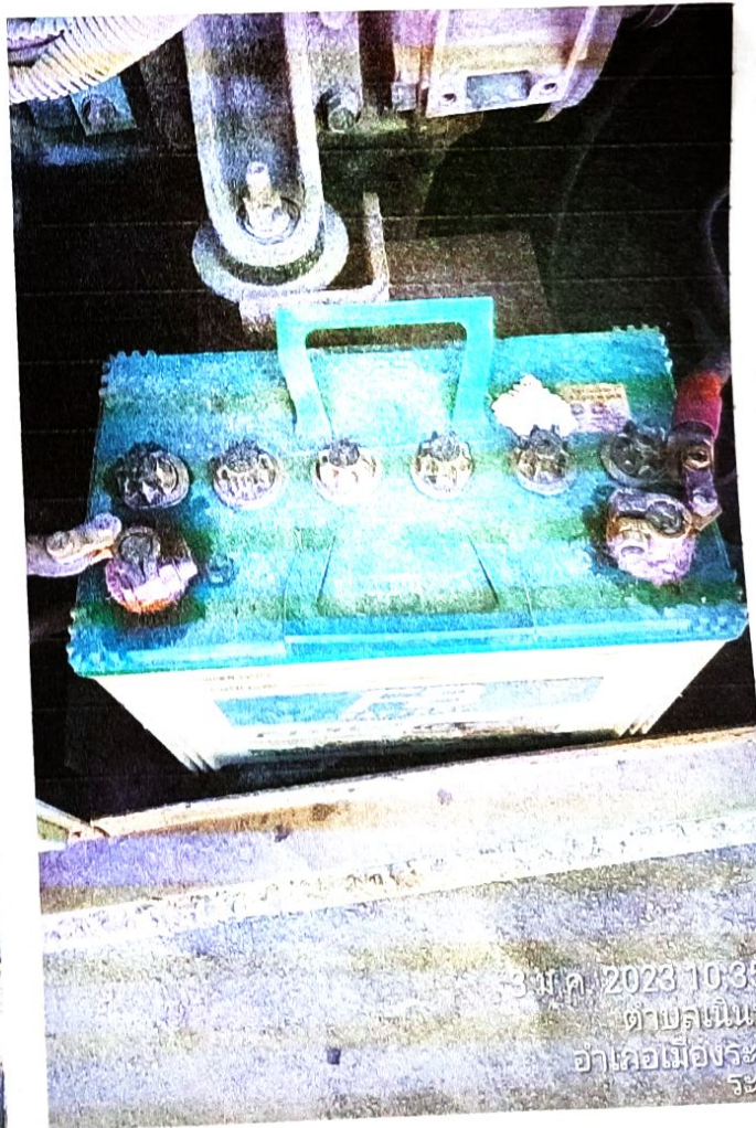
3 ม.ค. 2023 10:35 ตำบลเนินพระ อำเภอเมืองระยอง ระยอง