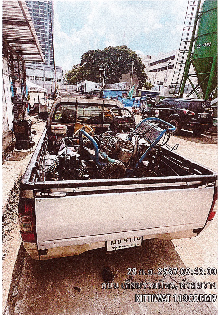
28 ก.ย. 2567 09:43:00 ถนน เทียมร่วมมิตร, หัวขวง KITTIWAT 118CORM9