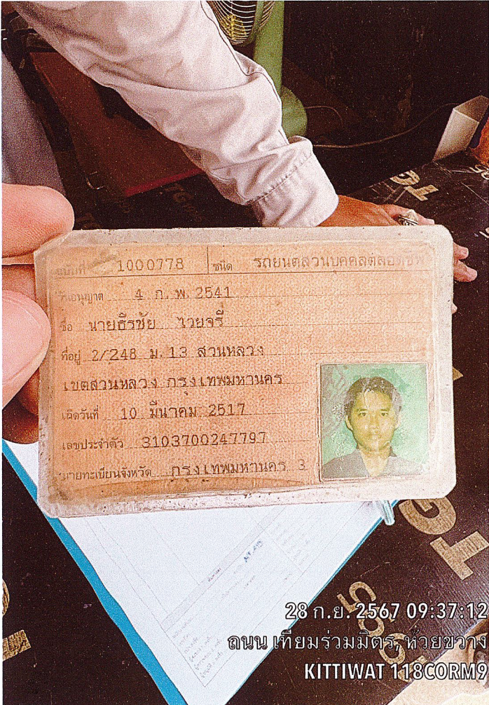
28 ก.ย. 2567 09:37:12 ถนน เทียมร่วมมิตร, หัวขวง KITTIWAT 118CORM9