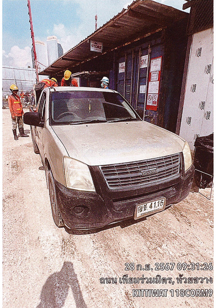
28 ก.ย. 2567 09:31:26 ถนน เทียมร่วมมิตร, หัวขวง KITTIWAT 118CORM9