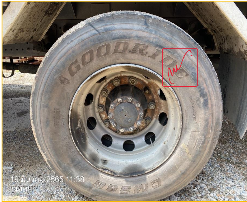
19 มีนาคม 2565 11:38 รุ่งทิพย์