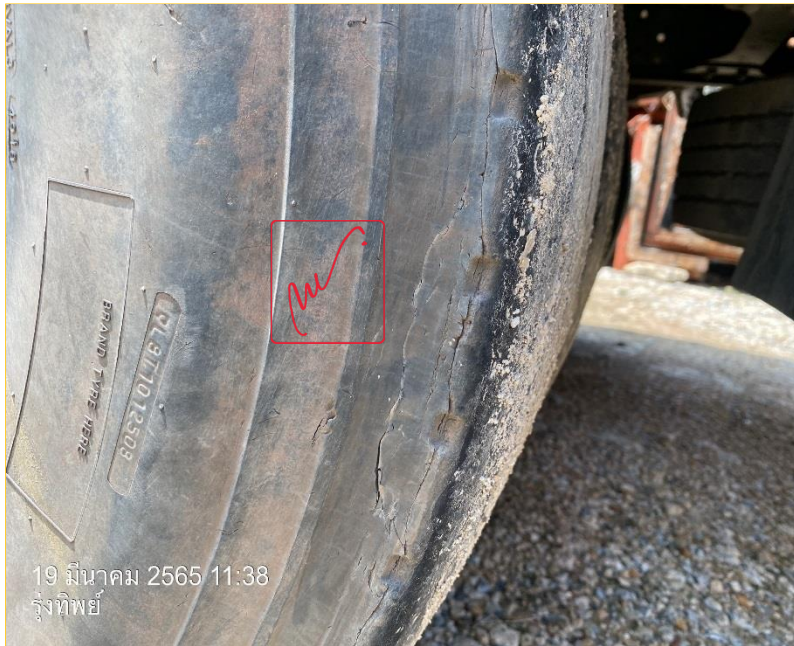
19 มีนาคม 2565 11:38 รุ่งทิพย์