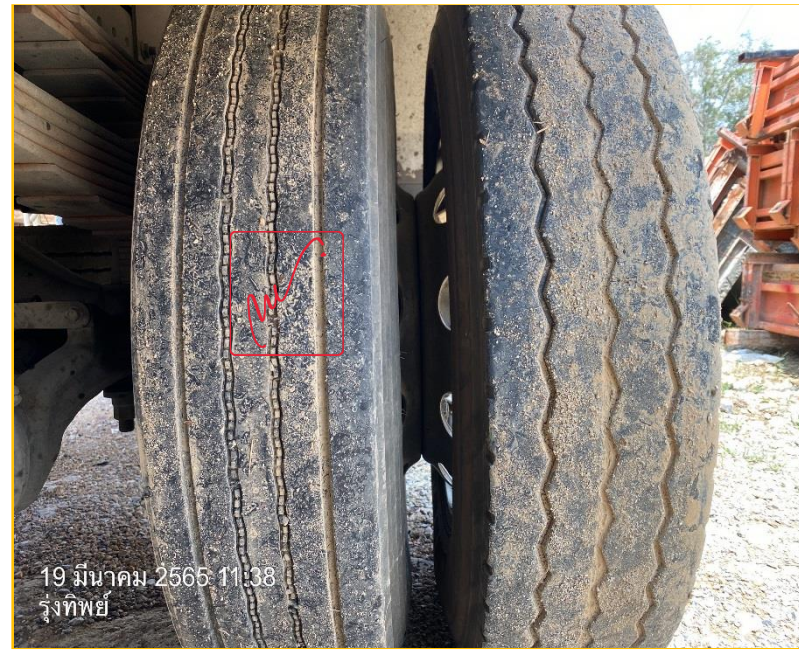
19 มีนาคม 2565 11:38 รุ่งทิพย์