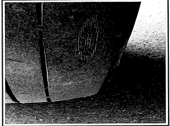
ยางหน้าด้านขวา ยางบางเห็นลวดสลิง