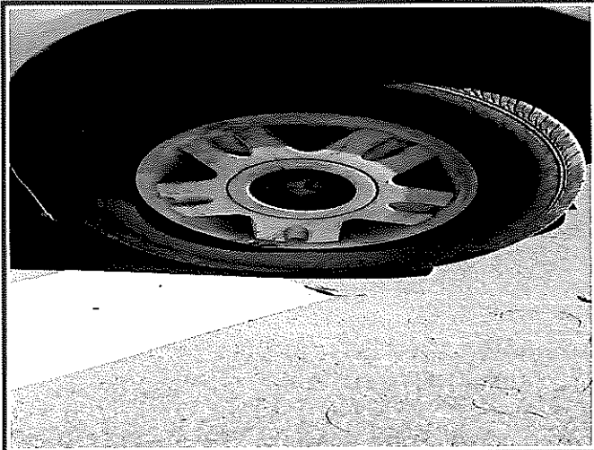
ยางหน้าด้านขวา ยางบางเห็นลวดสลิง