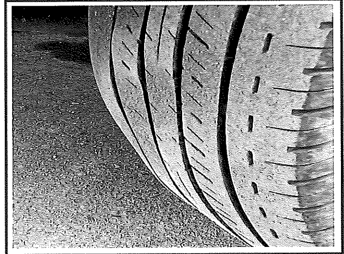
ยางหน้าด้านซ้าย ยางบวมเป็นลูกคลื่น