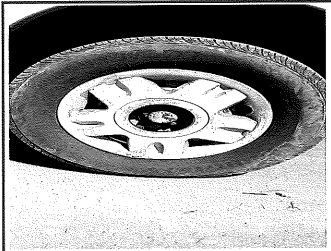
ยางหน้าด้านซ้าย ยางบวมเป็นลูกคลื่น