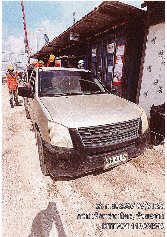
28 ก.ย. 2567 09:31:26 ถนน เทียมร่วมมิตร, หัวขวาง KITTIWAT 118CORM9