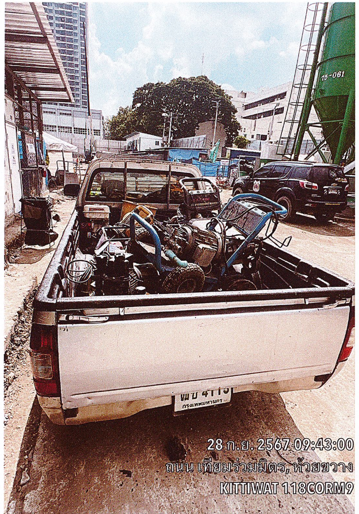
28 ก.ย. 2567 09:43:00 ถนน เทียมร่วมมิตร, หัวขวาง KITTIWAT 118CORM9