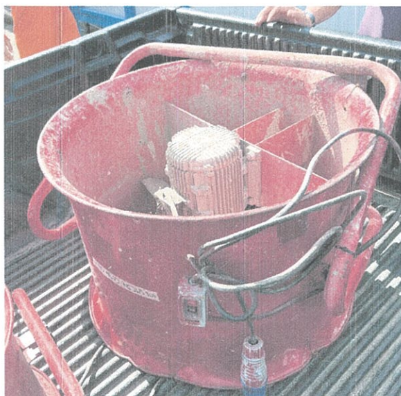
ภาพประกอบ1