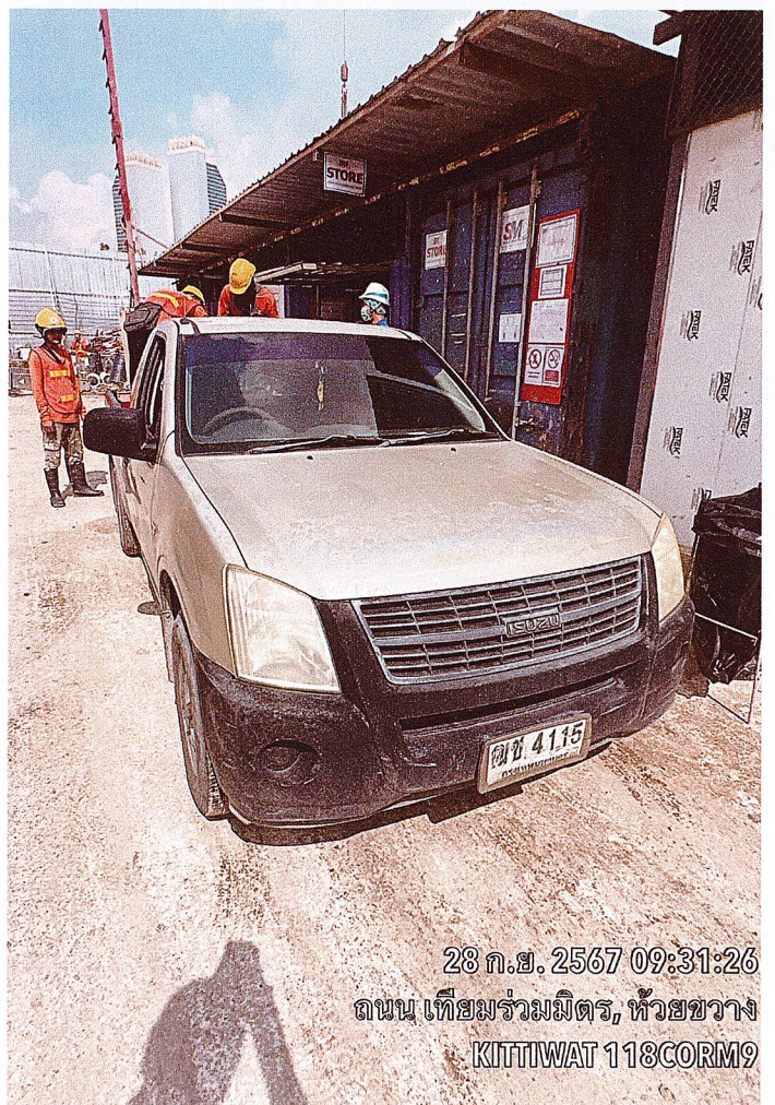
28 ก.ย. 2567 09:31:26 ถนน เทียมร่วมมิตร, ห้วยขวาง KITTIWAT 118CORM9