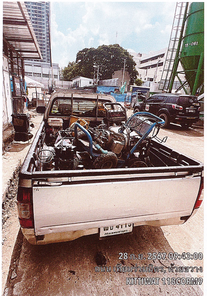
28 ก.ย. 2567 09:43:00 ถนน เทียมร่วมมิตร, ห้วยขวาง KITTIWAT 118CORM9