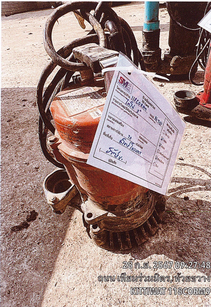
28 ก.ย. 2567 09:27:48 ถนน เทียมร่วมมิตร, ห้วยขวาง KITTIWAT 118CORM9