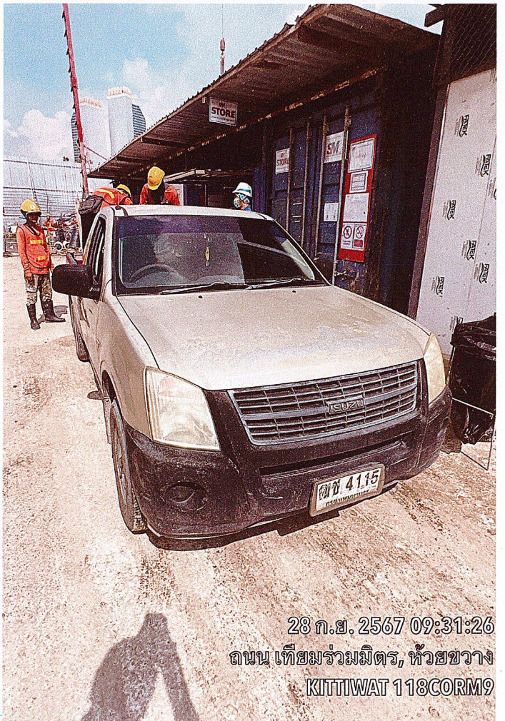
28 ก.ย. 2567 09:31:26 ถนน เทียมร่วมมิตร, ห้วยขวาง KITTIWAT 118CORM9