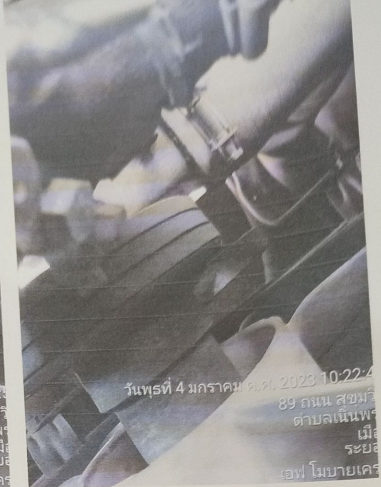
วันพุธที่ 4 มกราคม ค.ศ. 2023 10:22:4 89 ถนน สุขุมวิท ตำบลเนินพระ เมื่อ ระยอง เอฟ โมบายเคร