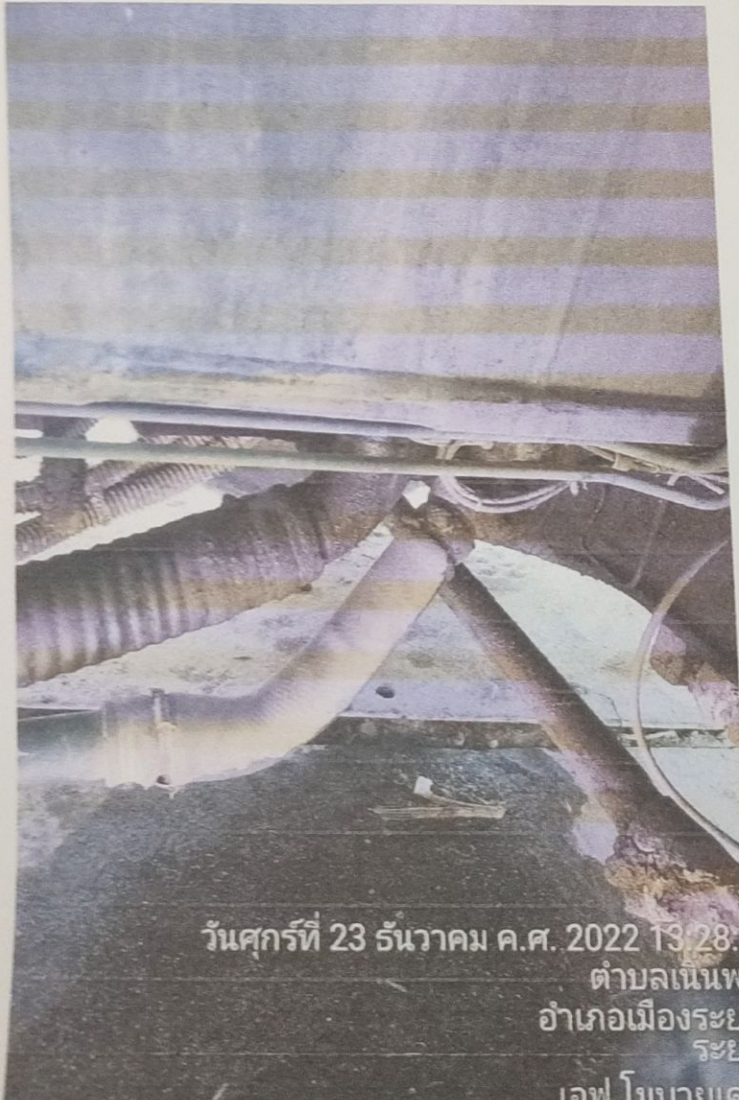
วันศุกร์ที่ 23 ธันวาคม ค.ศ. 2022 13:28:4 ตำบลเนินพระ อำเภอเมืองระยอง ระยอง เอฟ โมบายเคร