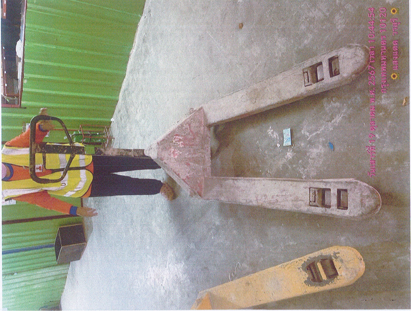
วันเสาร์ที่ 19 ตุลาคม พ.ศ. 2567 เวลา 10:44:54 กรุงเทพมหานคร 10120 แสงแดด วรสุริ