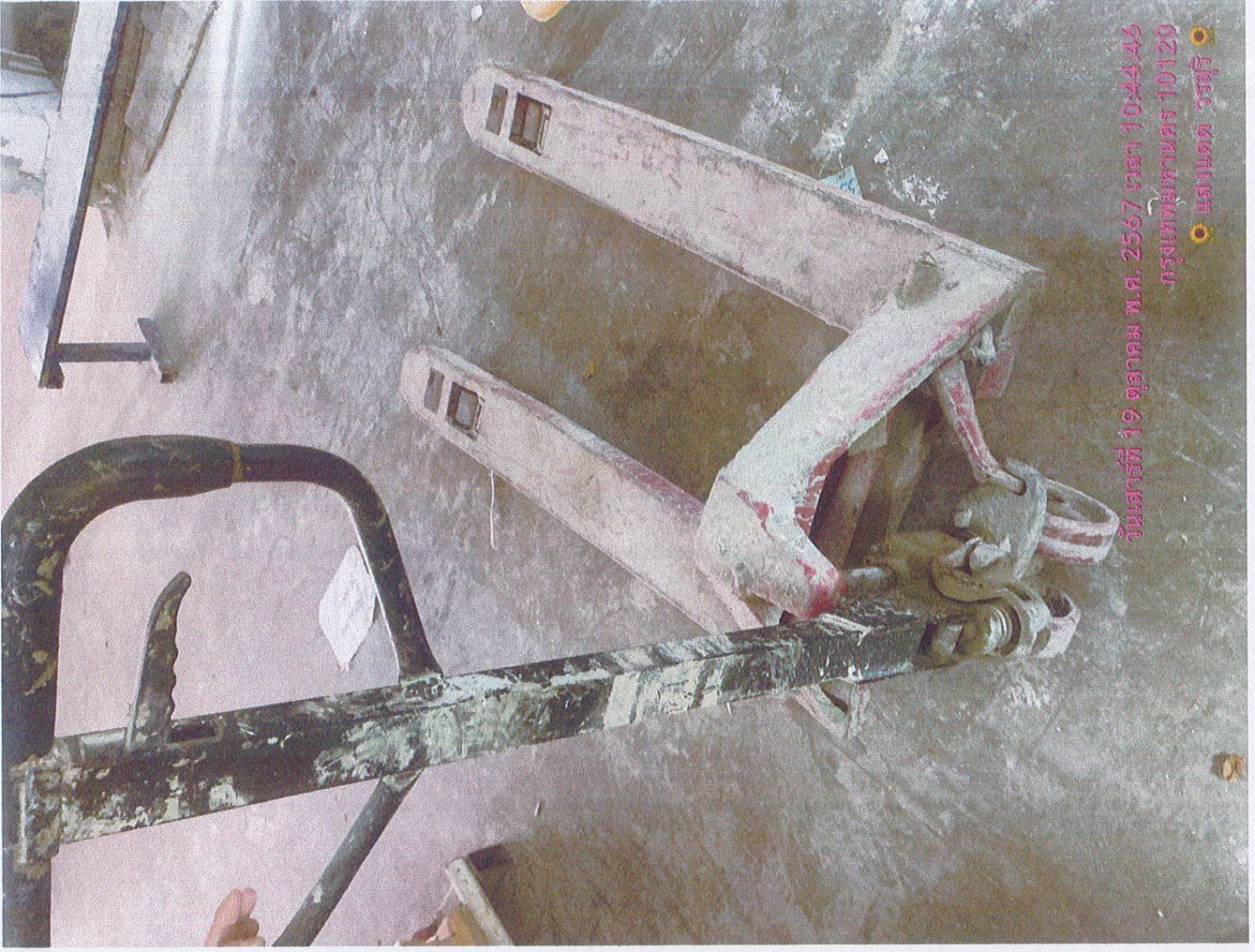
วันเสาร์ที่ 19 ตุลาคม พ.ศ. 2567 เวลา 10:44:46 กรุงเทพมหานคร 10120 แสงแดด วรสุริ